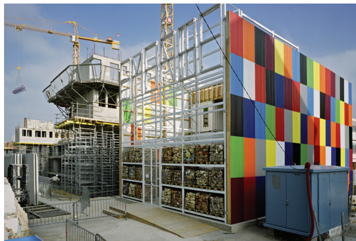
Construction de l'atelier TRANS305, 2010

t/ + 33 (0) 1 4225 1558 / www.archibooks.com